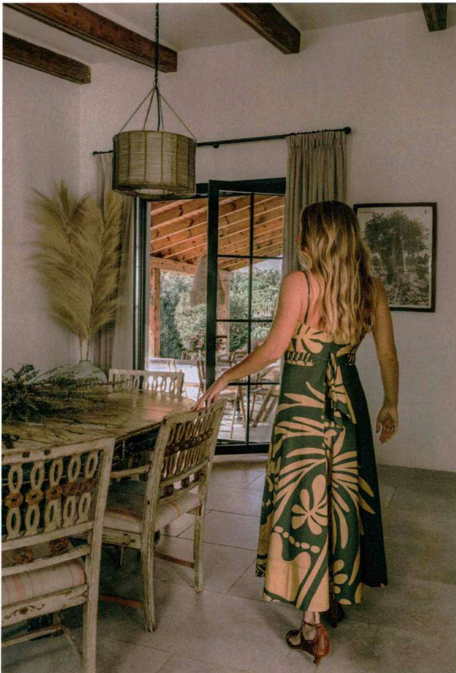
LOOK: VESTIDO DE JOHANNA OKTIZ; PENDIENTES DE RITA & CO. PARA ES FASCINANTE; SANDALIAS DE GIORGIO ARMANI